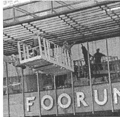
Foorumi ärimaja.

Teenindusbüroode sulgemise valiku kriteeriumiks oli Paloveeri sõnul eelkõige kulude ja teenindusbüroo töökoormuste analüüs. «Kogu teenindusmahust toimub 11 suletavas büroos vaid viiendik