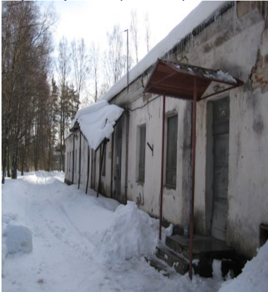
Hoone, milles OÜ Temer osutas pesumaja-teenust (märts 2010)